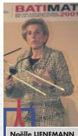
Noëlle LIENEMANN Ministre du Logement